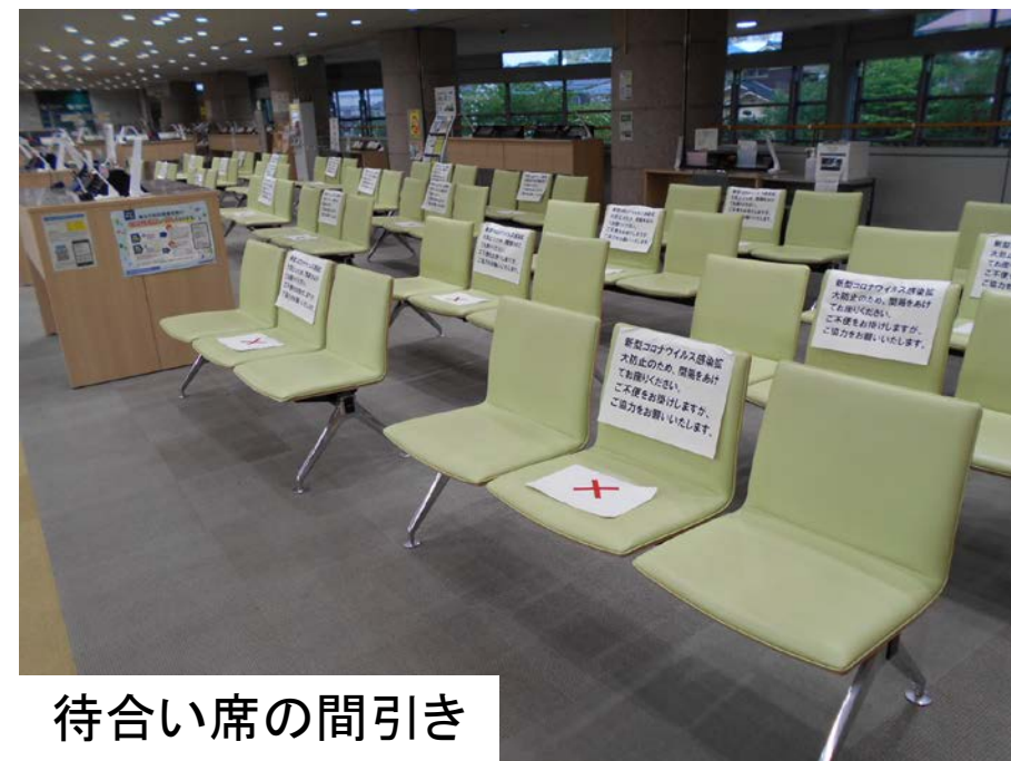
待合い席の間引き