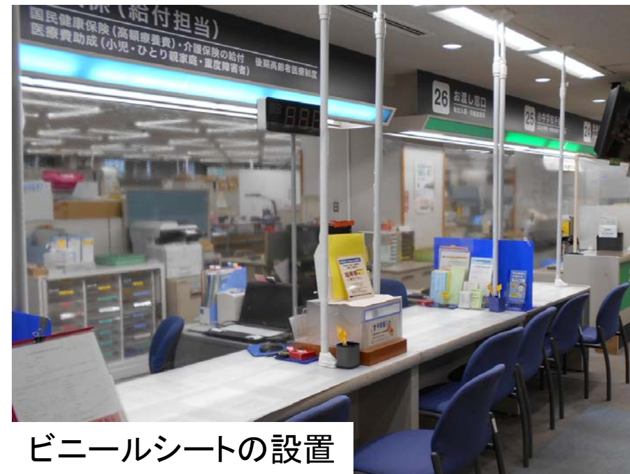
ビニールシートの設置