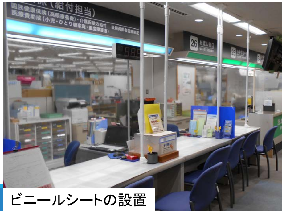
ビニールシートの設置