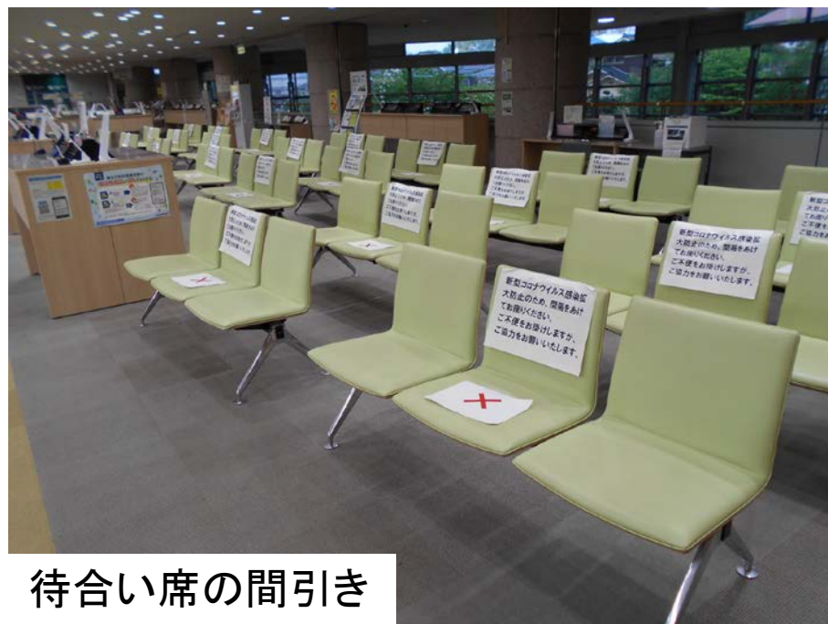
待合い席の間引き