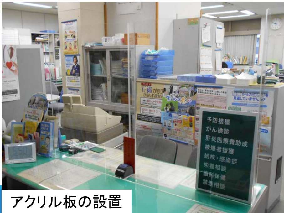
アクリル板の設置