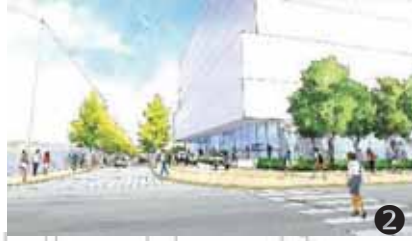
にぎわい・交流施設のイメージ